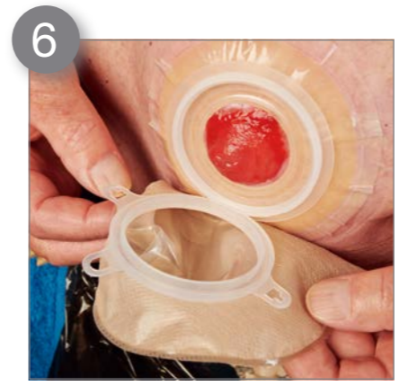
6 Befestigen Sie nun den Beutel mit der Basisplatte.