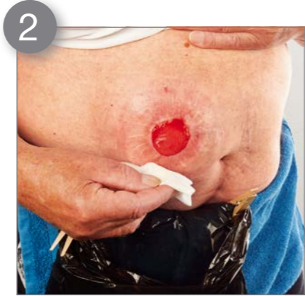
2 Reinigen Sie die Stoma umgebende Haut von außen nach innen. Bei einer Urostomie reinigen Sie bitte von innen nach außen.