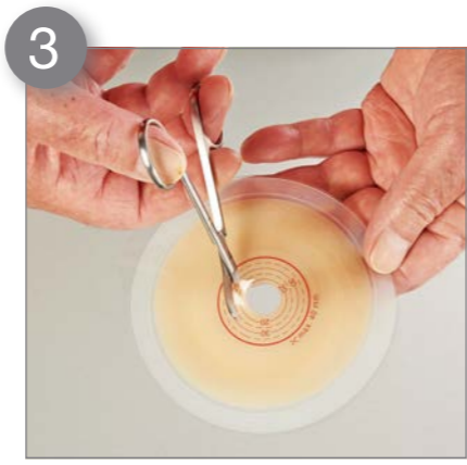
3 Schneiden Sie den Hautschutz Ihrer Basisplatte auf Ihre Stomagröße zurecht.