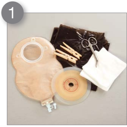
1 Legen Sie sich alle benötigten Materialien zum Versorgungswechsel zurecht.