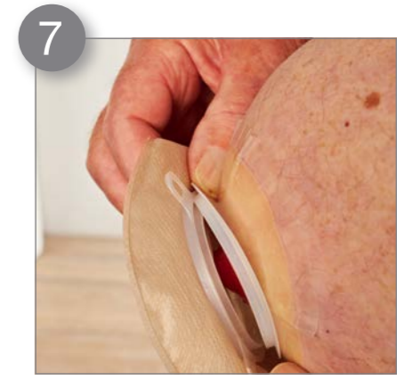
7 Achten Sie auf eine korrekte Verbindung zwischen Basisplatte und Stomabeutel.