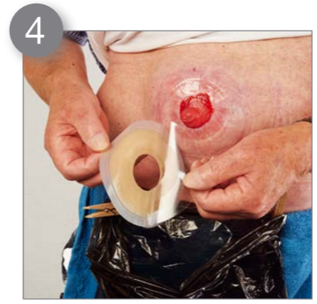
4 Entfernen Sie nun die Schutzfolie vom Hautschutz Ihrer Basisplatte.